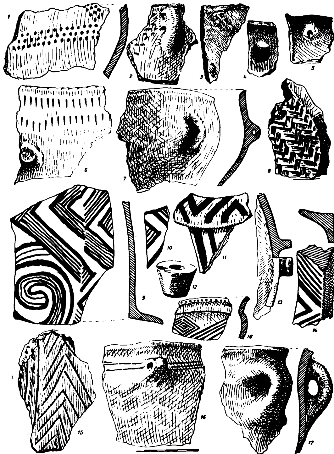
Fig. 3. — Sîntimbru. Fragmente ceramice aparținând culturilor neolitice de tip Turdaș și de tip Petrești.

(fig. 4/2), creștături adânci (fig. 4/1), benzi hașurate sau butoni rotunzi, câteodată creștați și benzi hașurate în spirale duble (fig. 4/7). Ca forme deosebite amintim marile urne funerare