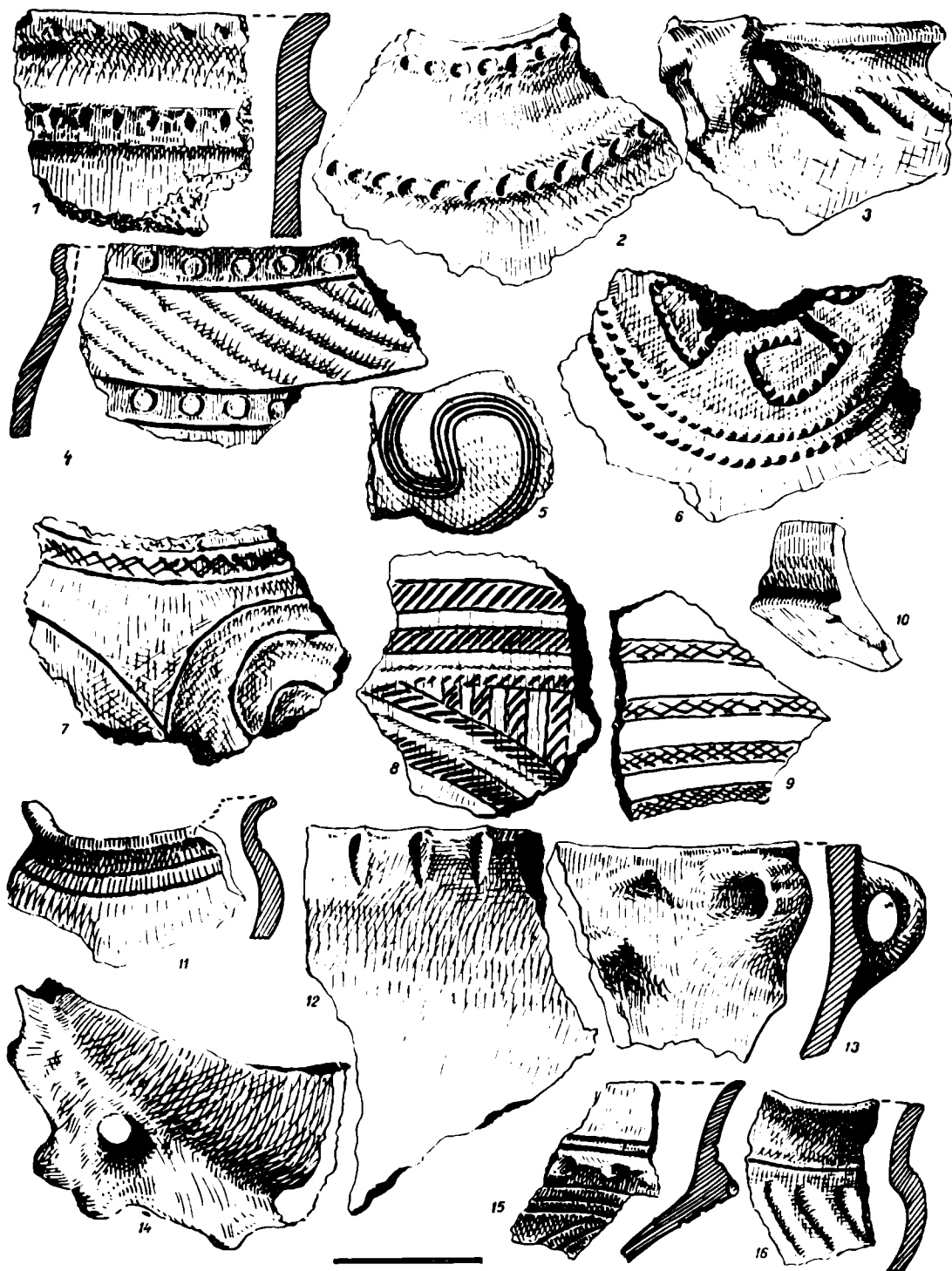
Fig. 4. Sintimbru. Fragmente ceramice aparținând culturii Wietenberg.

negru cu slip negricios (fig. 2); b ) fragmente de vase și vâscioare, farfurii în colțuri, din lut negricios, cu slip pe ambele fețe, negru sau gălbui, buze teșite în interior sau